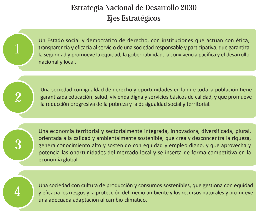
Figura 1: Ejes Estratégicos de la Estrategia Nacional de Desarrollo 2030